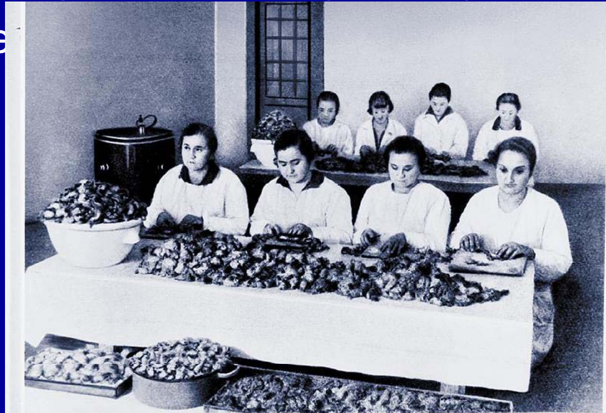
ORGANOTHERAPIÁS SZERVEK TISZTÍTÁSA.

În a.1907 uzina începe producerea preparatelor farmaceutice în proporții industriale. Este organizată producerea preparatelor organoterapeutice, sintetice organice și anorganice (lecitina, vitamine, insuline etc.)